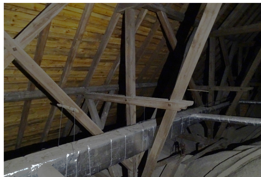
WIDOK WIĘŻBY DACHOWEJ - STAN ISTNIEJĄCY