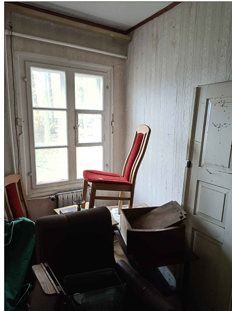
FOT. 10 WIDOK WNĘTRZA WRAZ ZE STOLARKĄ OKIENNĄ