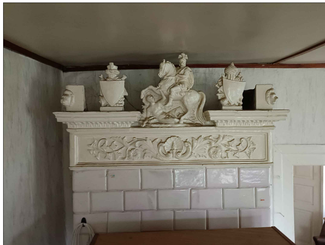
FOT. 12 WIDOK ZWIĘCZENIA PIECA KAFLOWEGO