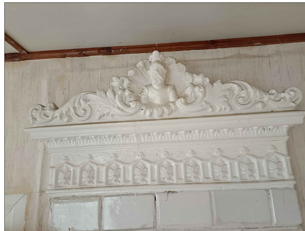
FOT. 13 WIDOK ZWIĘCZENIA PIECA KAFLOWEGO