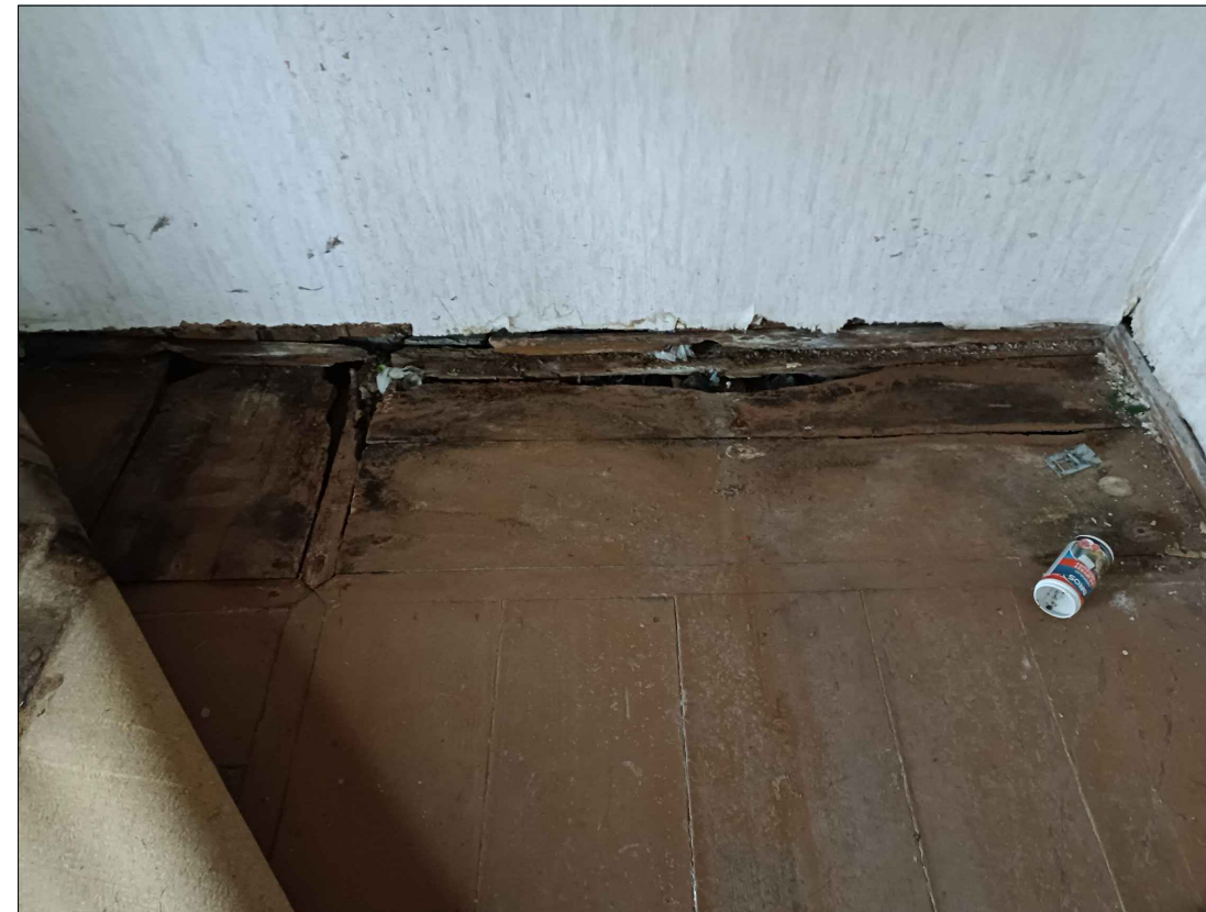
FOT. 8 STAN WIĘKSZOŚCI POSADZEK