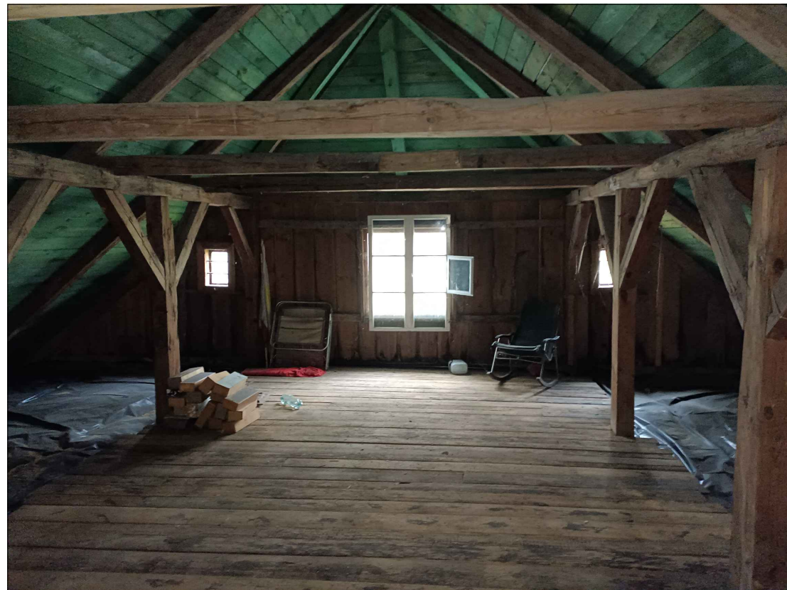
FOT. 5 WIDOK PODDASZA