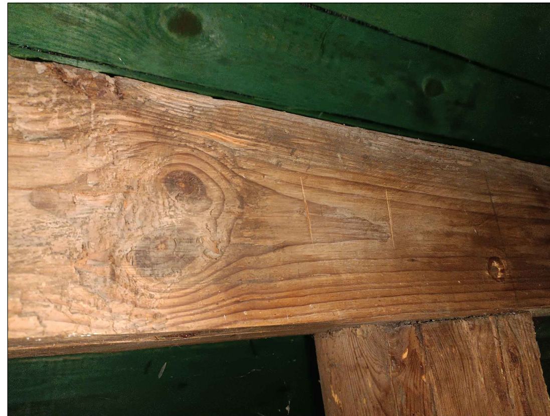
FOT. 6 ZNAKI CIESIELSKIE NA WIĘZBIE (CZĘŚCIOWO JAKO OZNACZENIA OŁOWKIEM)